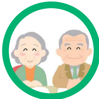
離れて暮らしている お祖父さんやお祖母さんへ