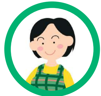
仕事やお買い物中 のお母さんへ