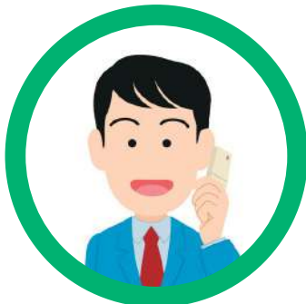
仕事や出張中 のお父さんへ

※月額350円は標準定価となります。 導入する条件によっては 料金が変動する場合があります。