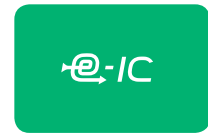
[カード式タグ] カードをかざすタイプ 出席管理も可能

「登下校みまもりサービス」は お子さまが学校に設置している リーダー付近(門や出入口等)を通過すると 登録しておいたメールアドレスへ 自動的に送信するシステムです。